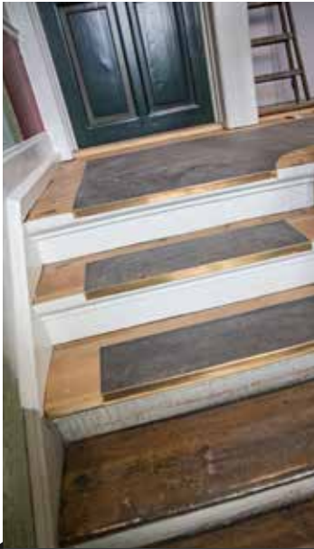
Trappeløbet renoveres, og her har man testet belægning og renoveringsmetoden.

tagterrasse og dels et lædække specielt til barnevogne, så de kære små kan sove i frisk luft”.