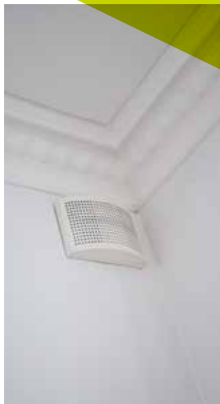
I en prøvelejlighed er ventilationsløsningen fuldt monteret. Til venstre ses overgangen fra vådrummet til fordelingsgangen, hvor det nedsænkede loft er blottet. Til højre ses hvordan stukken er blevet skånet