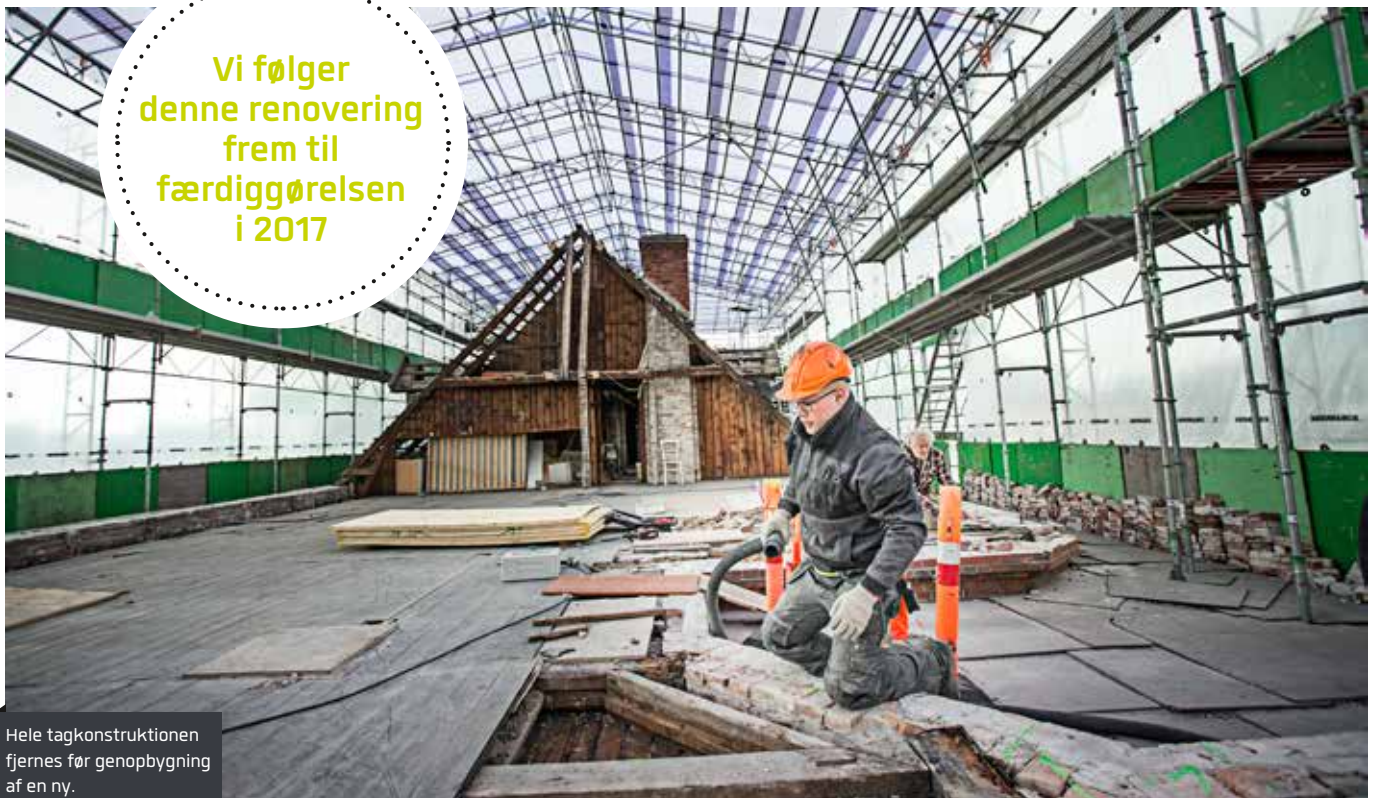
Hele tagkonstruktionen fjernes før genopbygning af en ny.

Vi følger denne renovering frem til færdiggørelsen i 2017