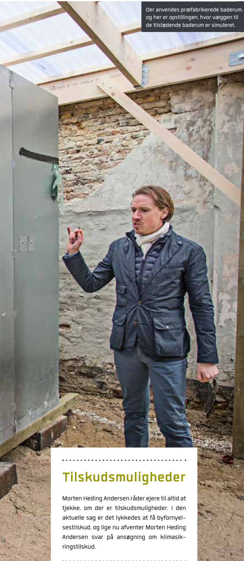
Der anvendes præfabrikerede baderum, og her er opstillingen, hvor væggen til de tilstødende baderum er simuleret.